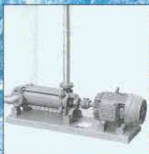
Pumpstation mit horizontaler mehrstufiger Hochdruckpumpe