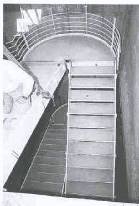
2 Montage der frei auskragenden, gut ausgesteiften Stahlterrasse