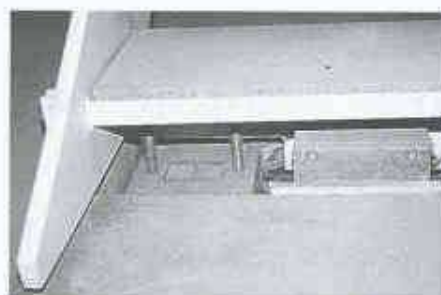
4 Aufnahme der vertikalen und horizontalen Kräfte durch zwei in den Achsen zueinander verdreht angeordnete Zug-Druck-Elemente. Oben: am Treppenfluss, unten: am Mittelpodest

Punkt 3.22.3 Mindestanforderungen an den Schutz gegen Innenlärm (Trittschall) L_{nT,w} in dB. Dabei gilt für den Bereich Treppen der Grad der Störung durch Innenlärm als mässig. Wird davon ausgegangen, dass eine Stahlterrassekonstruktion einen bewerteten Norm-Trittschallpegel L_{nT,w} > 75 \text{ dB} aufweist, und die Anforderungen an die Trittschalldämmung im Wohnungsbau zwischen L_{nT,w} 50 und 60 \text{ dB} (Mindestanforderungen je nach der Lärmempfindlichkeit der angrenzenden Räume) liegen, sind zum Erreichen dieser Anforderungen Trittschallverbesserungsmasse \Delta L_{nT,w} von 15 bis 25 \text{ dB} erforderlich. Für Stahlterrasse wurden bisher in der Mehrzahl der Bauten, obwohl von der Norm SIA 181 gefordert, solche Trittschallschuttmassnahmen gar nicht ausgeführt. Die erforderlichen Massnahmen sind deshalb beim Planer, aber auch beim Stahlbauer noch ungewohnt.