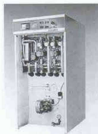
Modernste Heizungstechnik auf kleinstem Raum: Kombi-Heizschrank

Mit Stramax R 25 wird der Einbau einer Fussbodenheizung auch in bestehende Bauten möglich. Denn Stramax R 25 benötigt eine Aufbauhöhe von lediglich 25 mm - Dämmung und Lastverteilschicht inbegriffen. Die Kühldecke Stramax 2000 eignet sich als preisgünstige Lösung insbesondere in Kombination mit heruntergehängten Metalldecken beliebigen Fabrikats und kann auch nachträglich mit geringem Aufwand eingebaut wer-