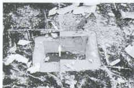
10 Verschiedene Wärmedämm-Dicken

Beim Schrumpfen von Abdichtungen werden durch die Abdichtung Zugkräfte ausgeübt, die in den Eckbereichen als typische Faltenbildung erkennbar werden. Die Zugkräfte, die beim Schrumpfen in der Abdichtung auftreten, können beachtlich