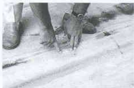
11 Dübel bei Belastung sichtbar