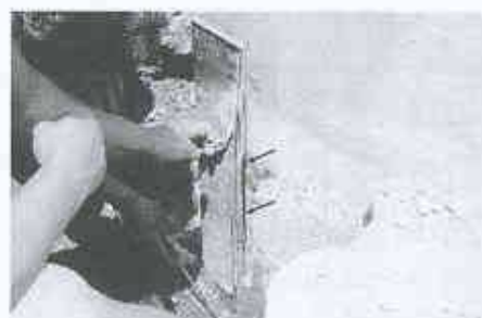
9 Keine Haftung der Kittfuge auf Anstrich