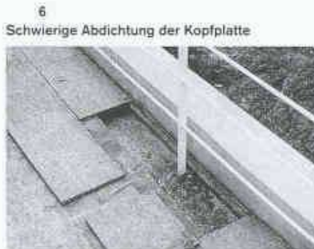
Das falsche Material am richtigen Ort