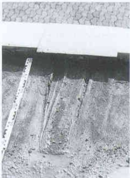
12 Aufreissen einer überstrichenen Blechdilatation