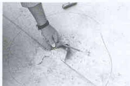
7 Unsorgfältige Verschweissung