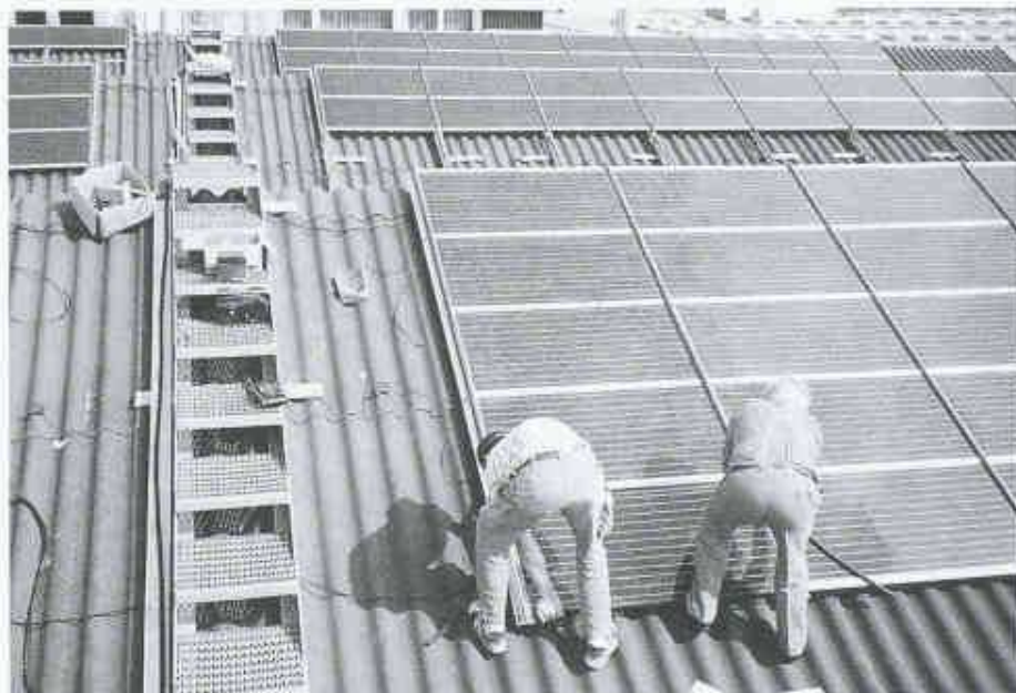
1 «Solarbahnhof» Luzern: Photovoltaikanlage auf dem Dach der Gewerbeschule Bahnhof Luzern