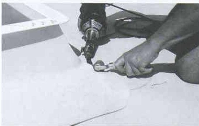
Verarbeitung der Dichtungsbahn mittels Heissluft-Schweisstechnik

Durch die optimierte Rezeptur wird eine hohe mechanische Festigkeit bei dünneren Schichtdicken erreicht. Für den Verarbeiter bedeutet das hohe Flexibilität und Dehnbarkeit. Die Detailausbildung auf dem Flachdach wird dadurch merklich erleichtert. Verarbeitet wird wie gewohnt mit der bewährten Heissluft-Schweisstechnik. Dabei entsteht keine Rauchentwicklung. Optisch ist die Kunststoffdichtungsbahn Sarnafil TG 66 für