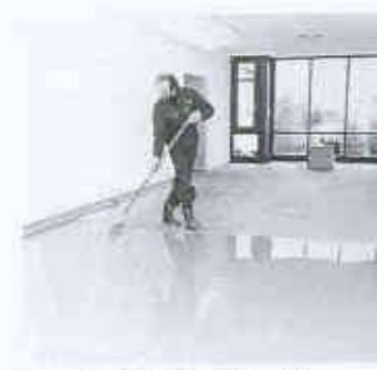
Besonders leichtverlaufend: die neue Nivelliermasse PCI-Fliessspachtel 15

Die Ausgleichsschicht härtet schnell. Bei +23 °C und 50% Luftfeuchtigkeit ist sie nach drei Stunden begehbar und mit keramischen Platten oder Natursteinen belegbar. Dampfdichte Beläge wie PVC-Beläge und Teppichböden mit Schaumstoffrücken sind nach drei