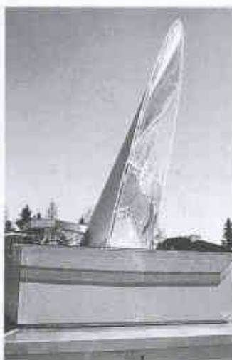
Pilotanlage in St. Gallen: Der Heliobus leitet Tageslicht in dunkle Räume

Signer Ingenieurunternehmen AG 9000 St. Gallen Tel. 071/278 62 20