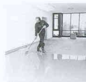
Besonders leichtverlaufend: die neue Nivelliermasse PCI-Fliessspachtel 15

Die Ausgleichsschicht härtet schnell. Bei +23 °C und 50% Luftfeuchtigkeit ist sie nach drei Stunden begehbar und mit keramischen Platten oder Natursteinen belegbar. Dampfdichte Beläge wie PVC-Beläge und Teppichböden mit Schaumstoffrücken sind nach drei