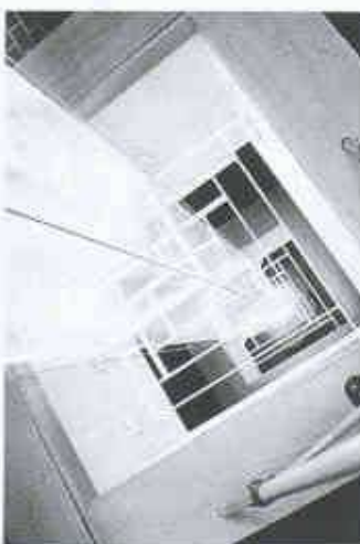
Hohllichtleiter mit lichtleitender Prismafolie