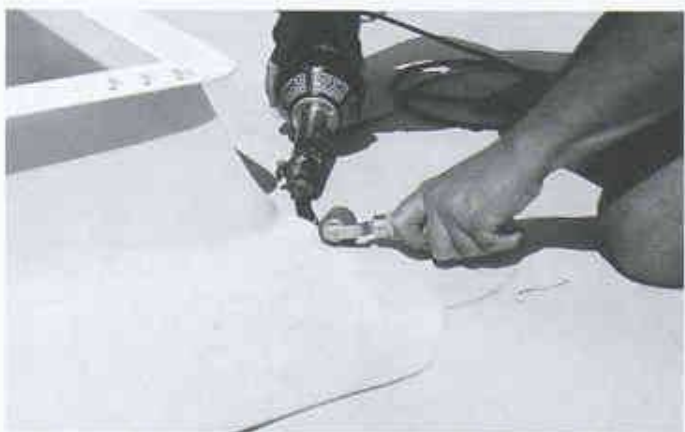
Verarbeitung der Dichtungsbahn mittels Heissluft-Schweisstechnik

Durch die optimierte Rezeptur wird eine hohe mechanische Festigkeit bei dünneren Schichtdicken erreicht. Für den Verarbeiter bedeutet das hohe Flexibilität und Dehnbarkeit. Die Detailausbildung auf dem Flachdach wird dadurch merklich erleichtert. Verarbeitet wird wie gewohnt mit der bewährten Heissluft-Schweisstechnik. Dabei entsteht keine Rauchentwicklung. Optisch ist die Kunststoffdichtungsbahn Sarnafil TG 66 für