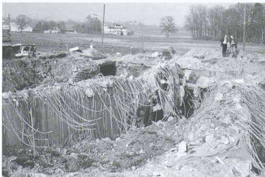
1 Vollständig zerstörtes Regenbecken

Durch Explosionswirkungen erheblich beschädigter Zulaufkanal, durch Bagger freigelegt