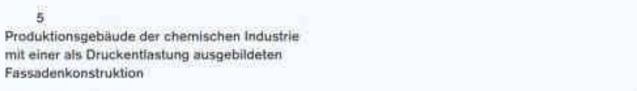
5 Produktionsgebäude der chemischen Industrie mit einer als Druckentlastung ausgebildeten Fassadenkonstruktion

Für eine aus Lärmschutzgründen notwendige Glas-Stahl-Überdeckung eines dichtbefahrenen Autobahnabschnittes durch ein städtisches Wohngebiet wurde