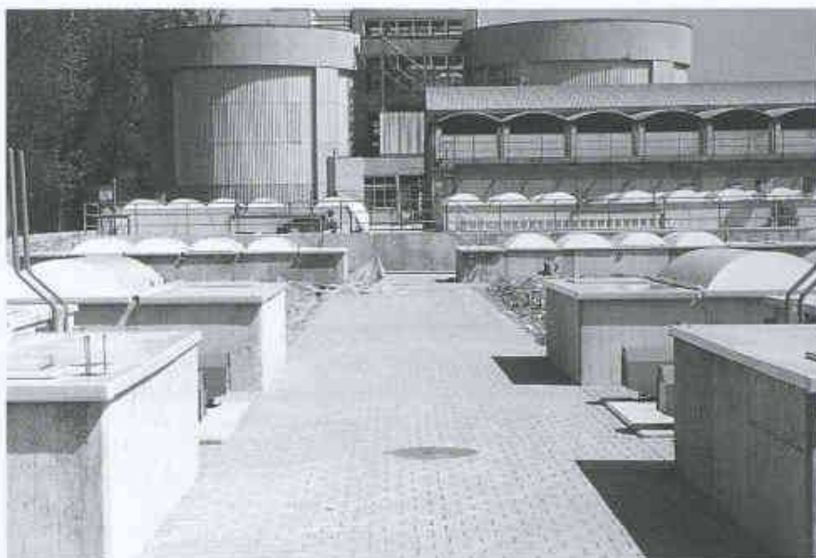
4 Abdeckungen der Druckentlastungsöffnungen grossvolumiger unterirdischer Klärbecken einer

Die Gestaltung von Druckentlastungsöffnungen ist oft problematisch, da Zielkonflikte auftreten. Eine grössere Wandöffnung ist unerwünscht, wenn ein Raum beispielsweise aus Sicherheitsgründen geschlossen sein muss. Auch Platz- oder konstruktive Probleme sind nicht immer einfach zu lösen. Andererseits bieten sich häufig ohnehin geplante Öffnungen, evtl. mit kleinen Anpassungen, als Entlastungsmöglichkeiten an. Die Phantasie der involvierten Ingenieure und Architekten ist hier besonders gefragt. Auch der Gestaltung von Abdeckungen sind kaum Grenzen gesetzt. Allerdings dürfen solche Elemente die Funktion der Entlastung nicht beeinträchtigen oder sie müssen bei der Bemessung berücksichtigt werden.