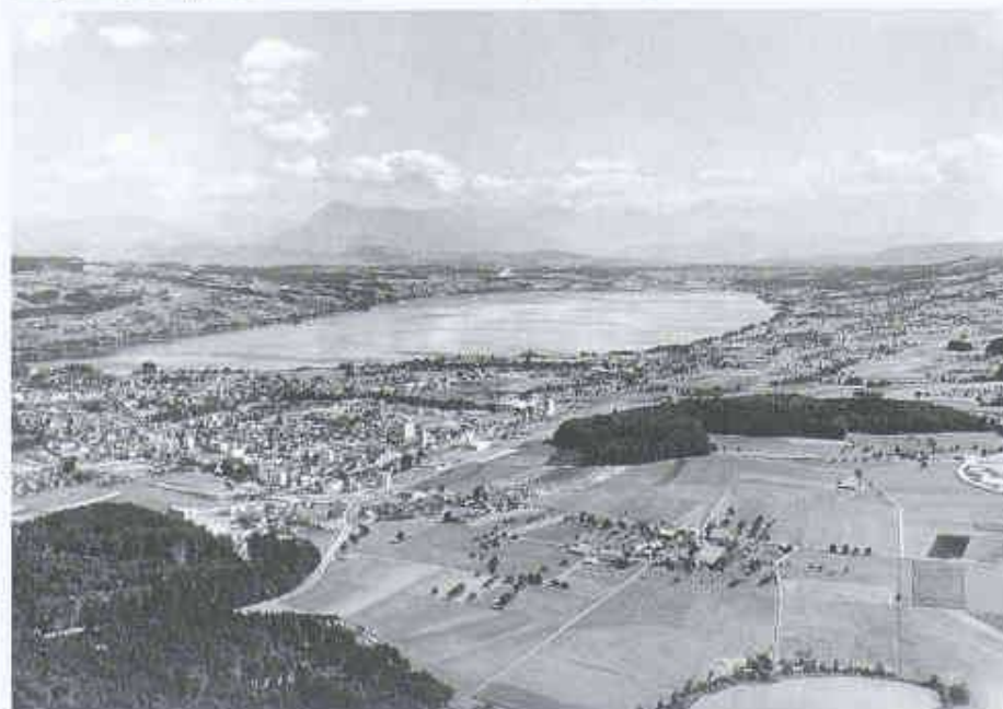
Sommer ausser Betrieb genommen werden

Weitere Auskunft und Anmeldebögen sind erhältlich bei: Austauschdienst ETH Zürich, IAESTE Praktika, Rämistrasse 101, 8092 Zürich, Telefon 01/632 20 67/71, Fax 01/632 12 64.