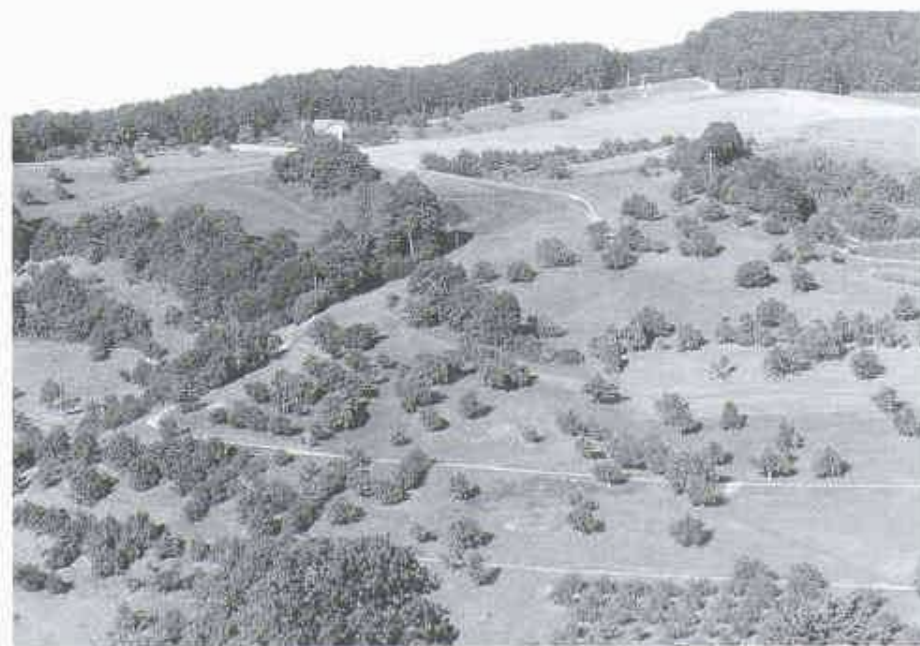
1 Vielfältige, naturnahe Kulturlandschaft (Oberfricktal AG. Foto: Schweiz. Stiftung für Landschaftsschutz)