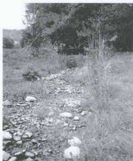
4 und 5 Revitalisierte Bäche im Landschafts- und Siedlungsraum.