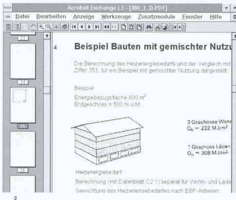
2 Darstellung einer Norm am Bildschirm

Nachdem das Projekt durch die Vereinsorgane genehmigt war, wurde im Frühjahr 1995 der Auftrag zur Digitalisierung und Verknüpfung des SIA-Normen-