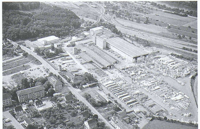
Firmengelände der Brodtbeck AG, Pratteln