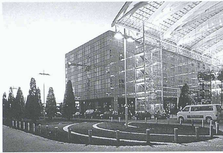
Blick ins Atrium

Er erzeugt Stimmung, er bildet sie nicht ab. Garten ist jederzeit erlebbar. Er öffnet und schliesst sich zur Landschaft, bleibt aber als Teil der ihn umgebenden Landschaft eigenständig. Im Garten soll sich nicht die Frage nach dem Sinn des Lebens stellen, in ihm soll der Sinn des Lebens genossen werden. Garten artikuliert auf seine Weise den Sinn des Lebens - das ist seine Funktion: Er bildet den Wert menschlichen Lebens ab.