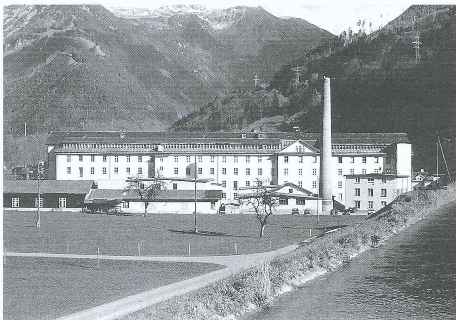
Eindrückliches Industrie-Ensemble in Haslen: Die Spinnerei und Weberei Jenny & Co., gegründet 1846, ist bis heute ein Textilbetrieb im Besitz der Gründerfamilie