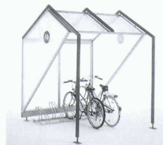
Fahrradbox der Wanzl AG