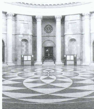
4000 m 2 Marmoleum wurden bei den «Four Courts of Ireland» in Dublin verlegt

Farben tragen zum Wohlbefinden, zum Wohnkomfort, zur Lernsteigerung oder gar zu therapeutischen Erfolgen bei. Forbo hat diese Erkenntnis beherzigt und eine neue, variantenreiche Kollektion ihres ökologischen Bodenbelages Marmoleum auf den Markt gebracht. 36 Farbstellungen in der Kollektion Marmoleum Real erlauben vielfältige