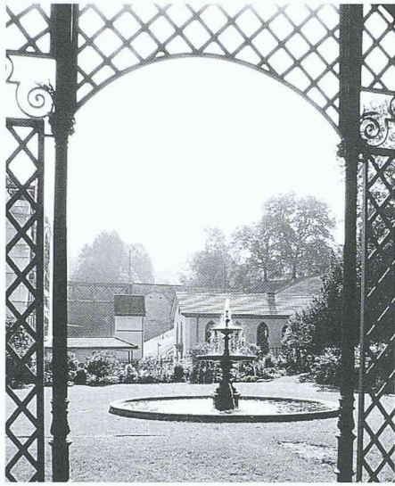
Im Spinnerei-Ensemble von Adolf Guyer-Zeller in Neuthal: ein Garten mit sehr romantischen Zügen