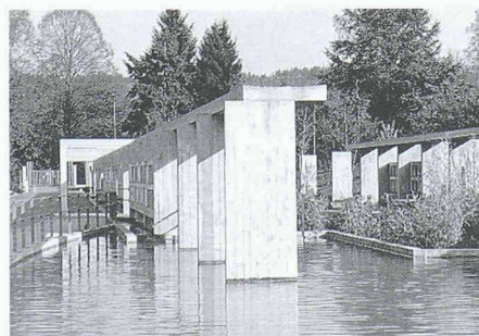
Erweiterung Friedhof Bümpliz, BE Architekten: U.O. Schweizer, W. Hunziker, Bern