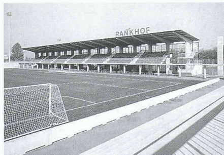
Fussballstadion Rankhof, Basel Architekten: Michael Alder + Partner, Basel