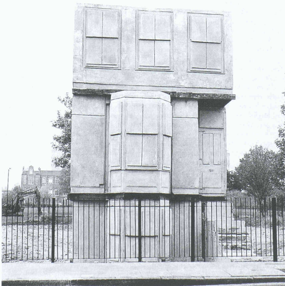
Rachel Whiteread, «House». London, 1993

Aber Häuser sind der Witterung ausgesetzt. «Finishing ends construction, weathering constructs finishes.» 9 So jedenfalls könnte es sein, wenn die Bewitterung als gestaltende und nicht als zerstörende Kraft angesehen würde. Au-