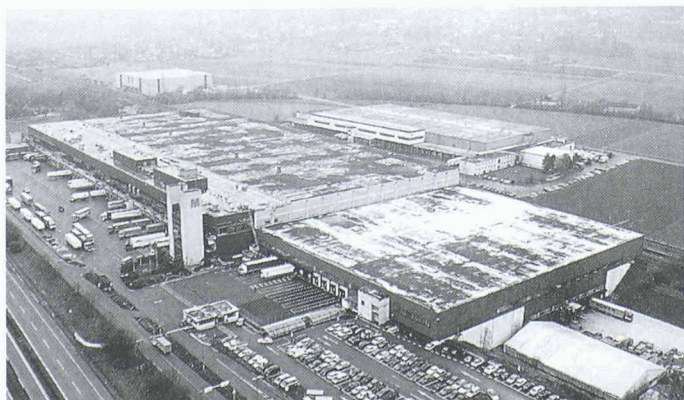
Migros-Verteilzentrum Neuendorf nach der ersten Sanierungsetappe von 8000 m 2

Grundfos Pumpen AG 8117 Fällanden Tel. 01/806 81 11