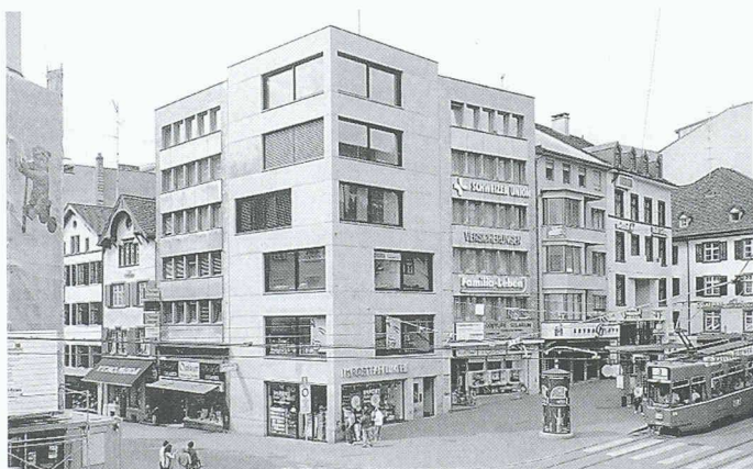
Wohn- und Geschäftshaus Steinenvorstadt, Diener & Diener