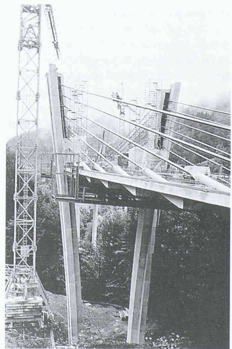
Die 540 m lange Sunnibergbrücke der Umfahrung Klosters im Bau: Gut sichtbar die auseinanderstrebenden Pylonpfeiler und die dünne Fahrbahnplatte

Um den Bezug zur Praxis zu schaffen, rückten die Organisatoren zwei aktuelle Grossprojekte in den Mittelpunkt der Gespräche: die Sunnibergbrücke und den Vereinatunnel, beides markante Tiefbauprojekte im Bündner Prättigau. Da die Sunnibergbrücke sehr exponiert ist, strebte der bekannte Brückenbauer Christian Menn in seinem Konzept eine hohe ästhetische Qualität an. Die Berücksichtigung