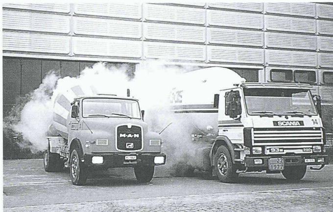
In einem Zisternenwagen wird der Flüssigstickstoff auf die Baustelle transportiert und dort direkt der Betonmischtrommel zugeführt

Ingenieure am Institut für Stahlbau haben gleichzeitig zwei Verbundträger fertiggestellt: Auf einem Stahlträger ruht ein Element aus Stahlbeton. Vor dem Beton-guss montierte man im Armierungseisen