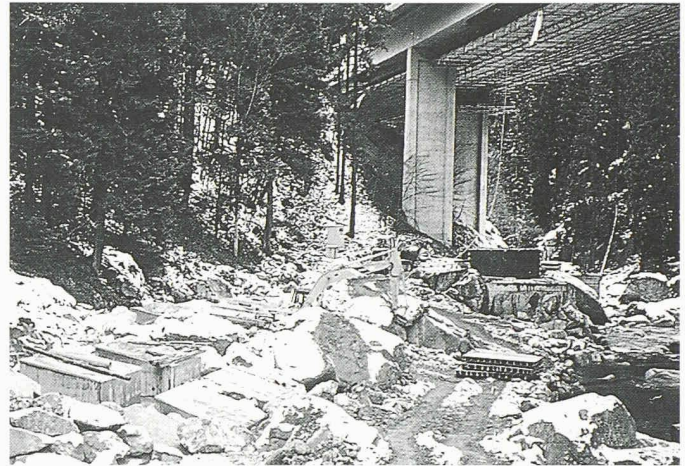
2 Betonprismen Pfeilerpaar Mitte (RO5)

blöcke können in die Betonprismen eingebunden werden und im besten Fall die geplante Anzahl der künstlichen Blöcke reduzieren.