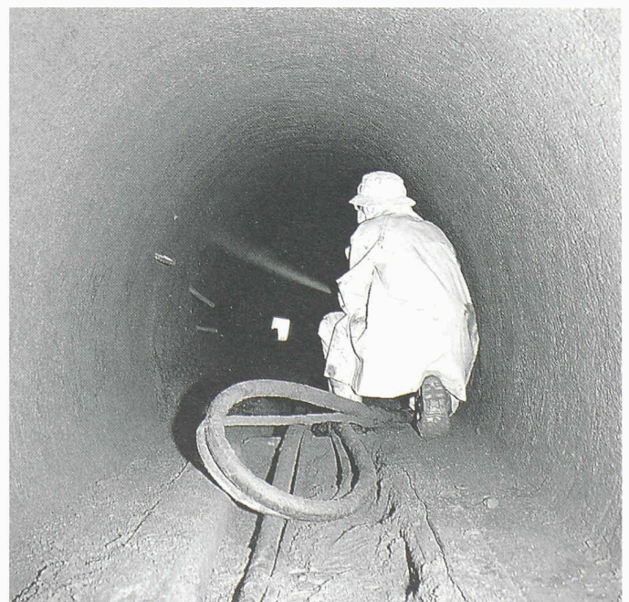
1 Spritzbetonapplikation im Abwasserkanal in der Neubrunnen- strasse in Zürich

Im Rahmen dieses Kurzbeitrags geht es nicht um die Erläuterung der Methode an sich, sondern um deren Anwendung in der Praxis. Deshalb werden einzelne Aspekte von Technologie, Anforderungen oder Randbedingungen lediglich im Rahmen der aufgeführten Beispiele gestreift.