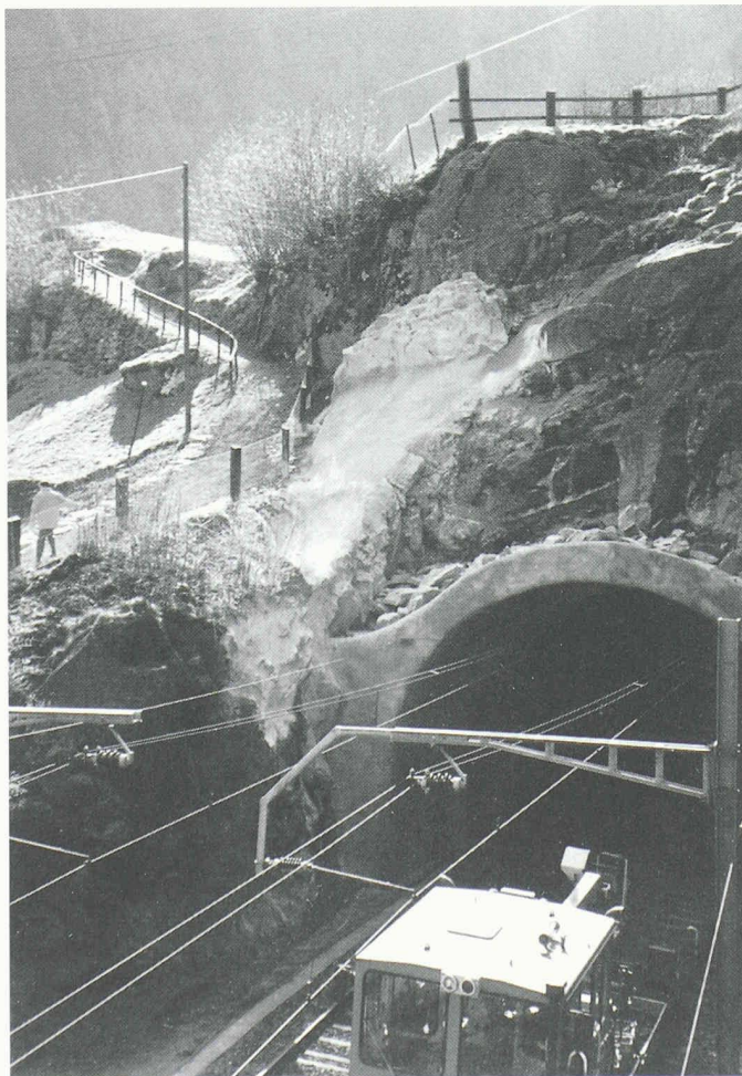
3 Ansicht des Nordportals nach der Massnahme

Für den Einbau der Stahlträger war eine Sperrung beider Gleise sowie das Ausschalten der Fahrleitungen notwendig. Für den Einbau der Träger standen in der Nacht vom 20. zum 21. Juli 1997 mehrere Totsperrungen von 30 bis 100 Minuten