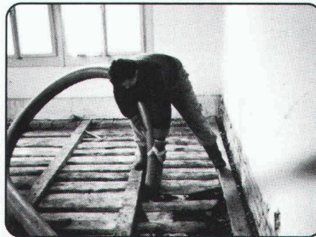
Absaugen von Zwischenböden bei Renovatio- nen, Umbauten und Sanierungen.