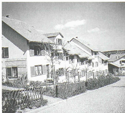
Wohnsiedlung «Sunnige Hof» in Schwamendingen. Architekt Karl Kündig, 1943

zu entscheiden, die die Erweiterung des Inventars schützenswerter Bauten mit rund hundert Objekten aus der Zeit zwischen 1920 und 1970 vorsieht. Erst kurze Zeit zurück liegt dieser Entscheid in Zürich, wo im Frühling 1998 eine Inventarergänzung gutgeheissen wurde, die rund 140 Bauten oder Gebäudegruppen aus der Periode zwischen 1935 und 1965 umfasst. Am Beispiel Zürich sollen nun die Überlegungen und Auswahlkriterien bei der Inventarisierung der genannten Architekturperiode etwas näher beleuchtet und anhand von konkreten Beispielen illustriert werden.