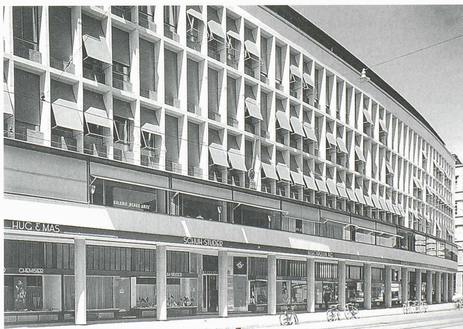
Geschäftshaus Bleicherhof. Architekt Otto Rudolf Salvisberg, 1939/40 (unten)

tes, selbsttragendes Aluminiumnetz konzipiert, das die Fensterverglasung wie die gläsernen Brüstungsplatten aufnimmt. 10