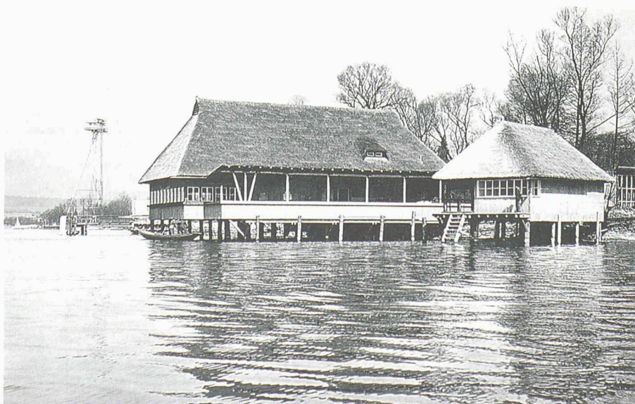
Fischstube, Teil des «Landidörfli» an der Landesausstellung von 1939. Architekt Karl Kündig

10 Vgl. dazu Christof Kübler: Standbilder des Zürcher Architekturgeschehens. In: 50 Jahre Auszeichnung für gute Bauten in der Stadt Zürich, Zürich 1995. S. 47 ff.