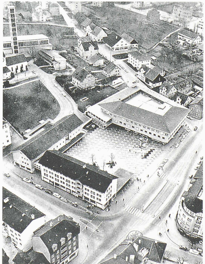
Lindenplatz in Altstetten. Architekten Werner Stücheli und Robert Landolt, 50er Jahre

Die Bauten der Nachkriegszeit sind in Zürich wichtige raumbildende Bestandteile hauptsächlich der neu entstandenen Aussenquartiere, aber auch im City-Bereich. Die Realisierung von städtebaulichen Konzepten in Form von ausgedehnten Wohnsiedlungen oder Quartierzentren ist typisch. Ein Musterbeispiel der