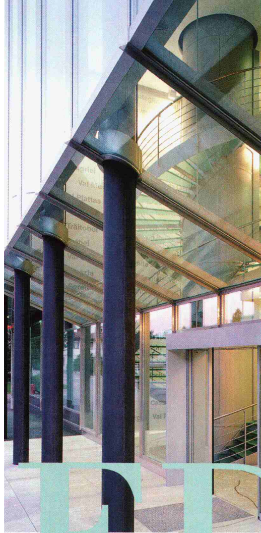
Die dreigeschossige Eingangshalle, transparentes Herzstück des neuen Verwaltungsgebäude der EWBO/OES AG, Illanz, Architekt: Jakob Mollatla.