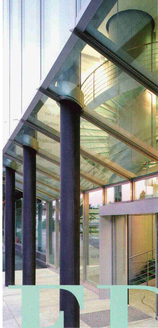
Die dreigeschossige Eingangshalle, transparentes Herzstück des neuen Verwaltungsgebäude der EWBO/OES AG. Illanz. Architekt: Jakob MONTALTA.