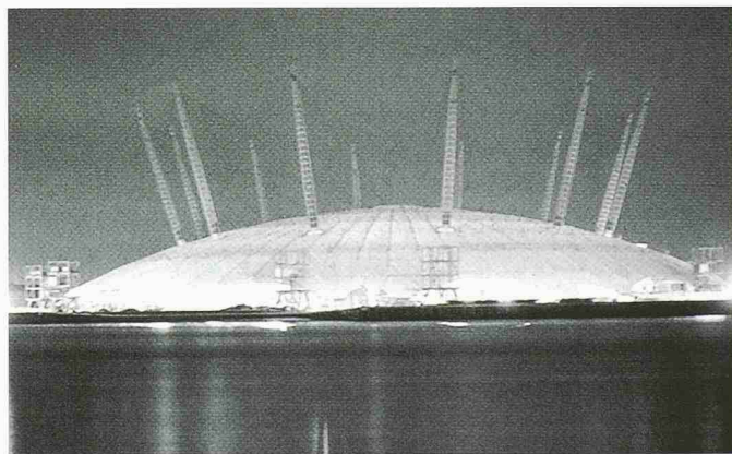
Millennium Dome London, 1998

RAG Reichenberger AG 6038 Gisikon Tel. 041/455 01 11