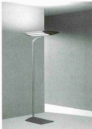
Indirekt-Beleuchtungssystem Legato P

Lichtmanagement-Systeme müssen verschiedenen Beleuchtungsanforderungen am Arbeits-