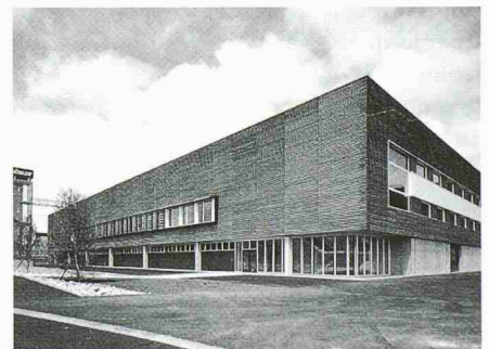
Einer der beiden Preisträger des Holzpreises 1999 ist die Trisa Bürstenfabrik AG in Triengen LU. Ihre neue Halle wurde vom Architekturbüro Steger & Partner, Reiden/Triengen, entworfen

Der zweite ausgezeichnete Bau, die neue Produktionshalle der Trisa Bürstenfabrik in Triengen LU, zeigt neue Wege der Ausführung eines Fabrikationsgebäudes auf. Die niedrig gehaltene Halle in der Grösse von 65 auf 85 Meter, gänzlich in Holz konstruiert, schwebt über einem Sockelgeschoss aus Beton. Das Holztragwerk des Hallendaches, von der Shedkonstruktion lichtdurchflutet, zeichnet sich durch seine filigrane Dimensionierung aus. Die 62 Meter langen brettschichtverleimten Hauptträger sind mittels V-Stützen in der Hallenmitte abgelagert. Die Konstruktion mit ihrer grossen Stützen-