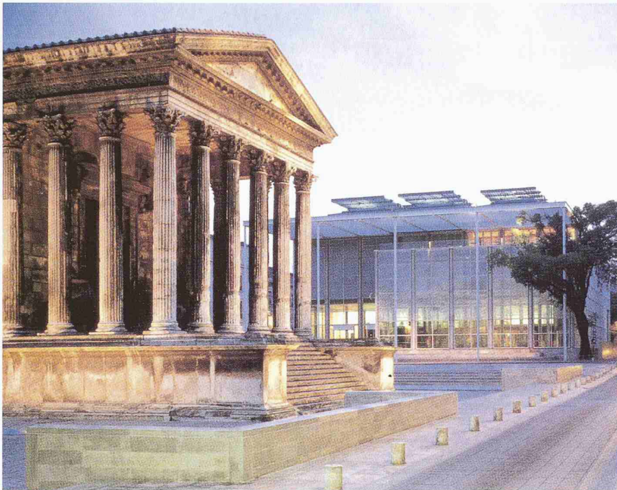
Carrée d'Art, Nîmes (cultural centre built adjacent to the ancient Maison Carrée)

for the Hongkong and Shanghai Banking Corporation's headquarters, for which he designed a tower 47 stories above a ground floor plaza.