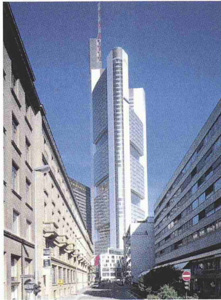
Commerzbank Headquarters, Frankfurt

In the three decades since, Sir Norman has produced a collection of buildings and products noted for their clarity, invention, and sheer artistic virtuosity. His work ranges in scale from the modest, but exquisite new addition of the Sackler Galleries to the existing galleries of the Royal Academy