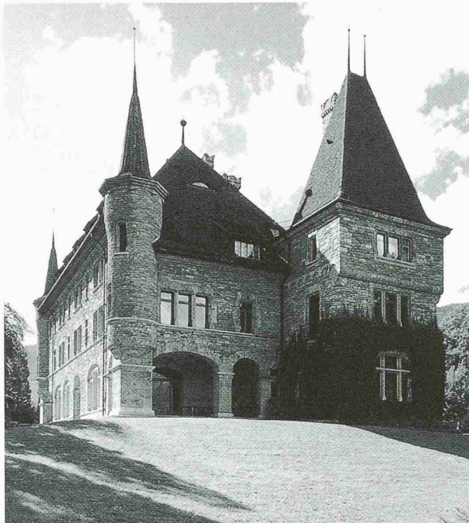
Die Pro Renova hat ihren diesjährigen Preis dem über der Stadt Siders gelegenen Château Mercier verliehen