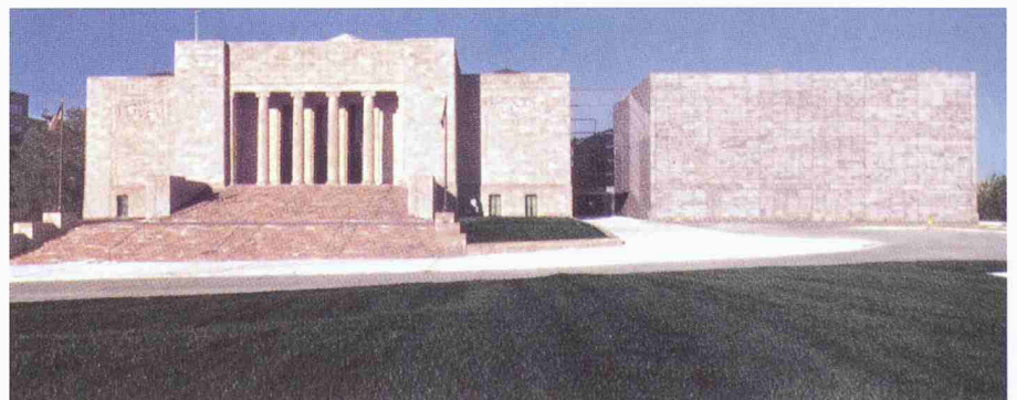
Joslyn Art Museum Addition, Omaha, Nebraska

Sir Norman Foster's pursuit of the art and science of architecture has resulted in one building triumph after another, each one in its own way, unique. He has re-invented the tall building, producing Europe's tallest and arguably the first skyscraper with an ecological conscience, the Commerzbank in Frankfurt. He cares passionately for the environment, designing accordingly. From his very first projects, it