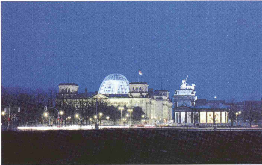
New German Parliament, Reichstag, Berlin