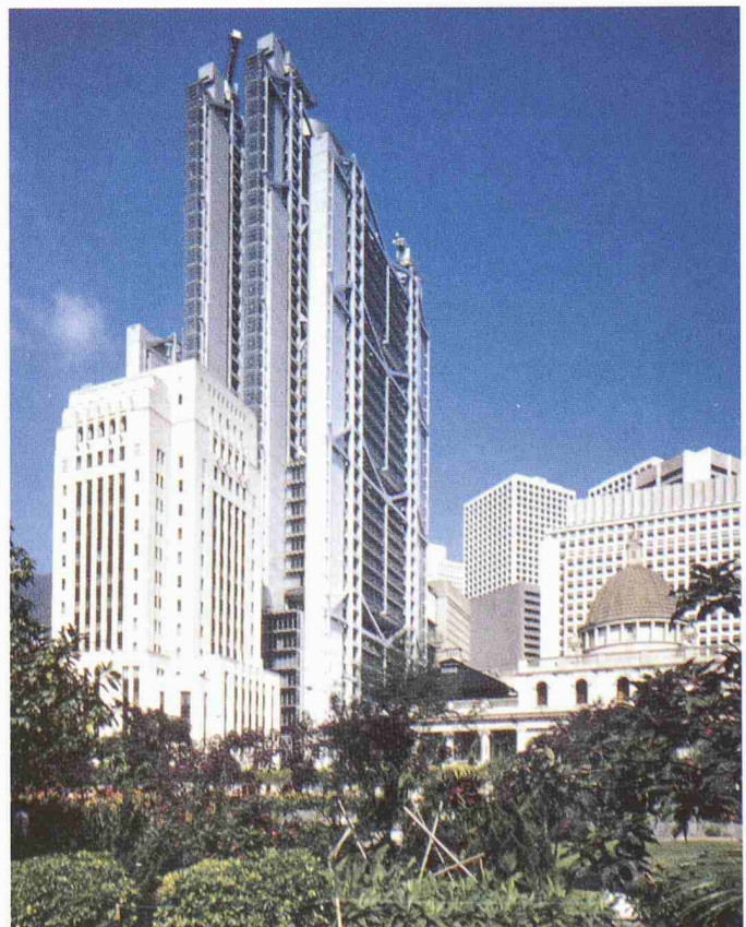
Hongkong and Shanghai Banking Corporation, Hong Kong

On a much larger and international scale, in 1979, he received the commission