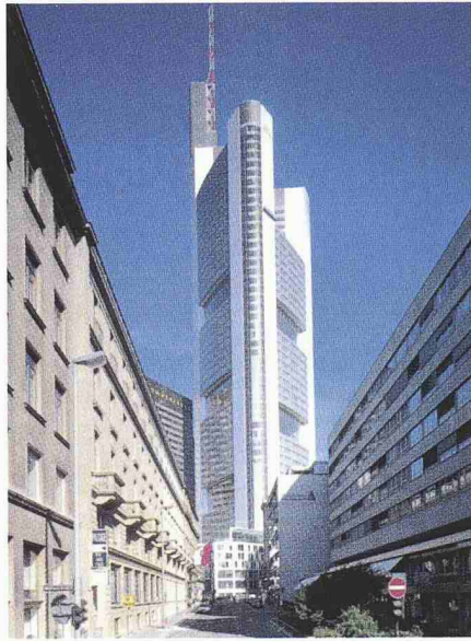
Commerzbank Headquarters, Frankfurt

In the three decades since, Sir Norman has produced a collection of buildings and products noted for their clarity, invention, and sheer artistic virtuosity. His work ranges in scale from the modest, but exquisite new addition of the Sackler Galleries to the existing galleries of the Royal Academy