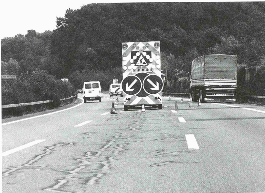
Sanierungsarbeiten an Autobahnen sollen gründlich, aber dennoch rasch und kostengünstig ausgeführt werden. An einer Besichtigungsfahrt zeigten das Bundesamt für Strassen und das Tiefbauamt des Kantons Bern auf, wie diese gegensätzlichen Anforderungen erfüllt werden sollen