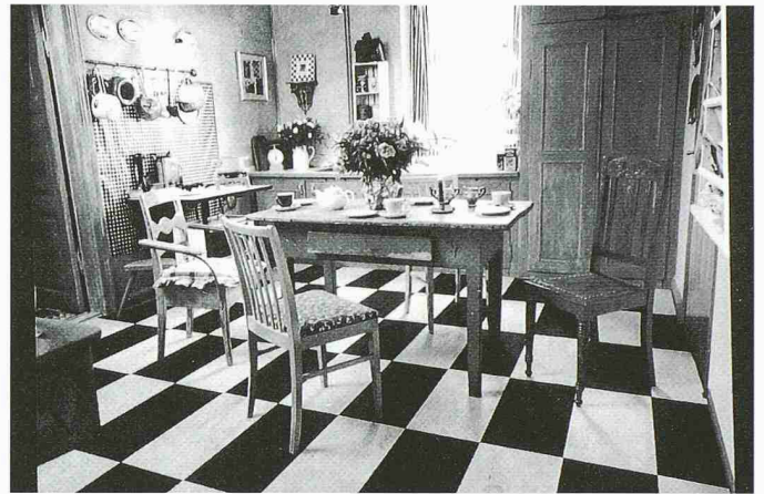
Wohnküche mit den Böden Eco Cork Sapphire und Comet von Wicanders

Das HZ-System besteht zum einen aus den HZ-Steigstrangprofilen aus hochschlagzähem und recyclefähigem Kunststoff. Sie verdecken auf elegante Weise jegliche Art von Steigleitungen. Sie sind aus streichfähigem Material, das auch tapeziert und sogar gefliest bzw. gekachelte werden kann, und sind in L- sowie in U-Form erhältlich. Die HZ-Sockelleistenprofile für horizontale Leitungen können für alle gängigen Rohrarten (Stahl, Kunststoff, Verbund, Kupfer) bis max. 28 mm Durchmesser verwendet werden. Die Profile gibt es in unter-