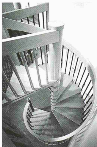
Die Keller Treppenbau AG bietet ein grosses Holztreppen-Angebot

Keller Treppenbau AG 3322 Schönbühl Tel. 031/859 23 13 Halle 1, Stand 101