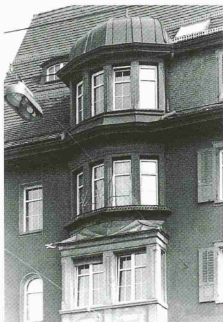
Dörig Fenster löst auch schwierige Anpassarbeiten

Dank dem flächendeckenden Servicestellennetz wird die Solaranlage zusammen mit der Heizung während deren gesamten Lebensdauer optimal betreut. Für die kostengünstige Heizungssanierung