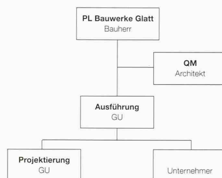
Modell 3: Planungsteam vom GU nominiert