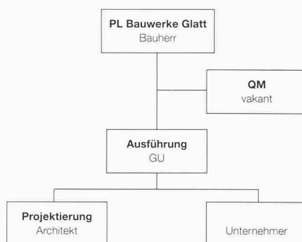
Modell 2: Planungsteam vom Bauherrn nominiert, arbeitet im Auftrag des GU