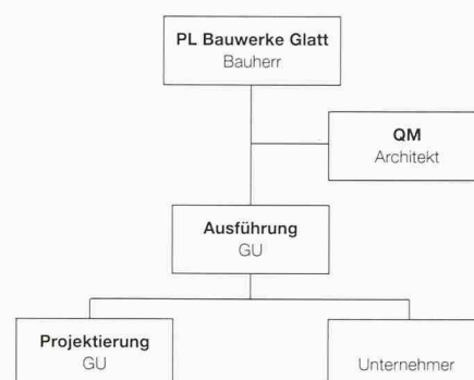
Modell 3: Planungsteam vom GU nominiert