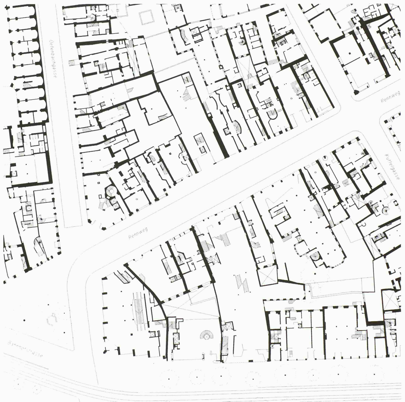
Zürich, linksufrige Altstadt, unterer Rennweg, 1996. Erdgeschoss, Mst. 1:750

wurden vom Untersuchungsareal zwei Planwerke erarbeitet; auf einem Plan wurde der heutige Zustand der Stadt wiedergegeben, auf dem anderen der älteste rekonstruierbare. Für beide Pläne wurden je drei Schnittebenen erstellt: Kellergeschoss, Erdgeschoss und erstes Obergeschoss. Als Grundlagen der Arbeit dienten Archivmaterial - vor allem Baupolizeipläne