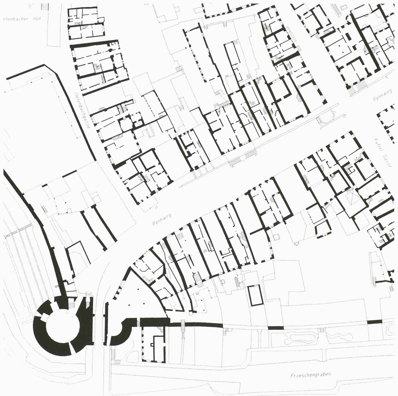
Zürich, linksufrige Altstadt, unterer Rennweg mit dem Rennwegtor, um 1865. Erdgeschoss, Mst. 1:750

hilfe konsultiert werden. Überlagerungen mit dem heutigen Kataster zeigten verblüffende Übereinstimmungen. Diese beiden Quellen, Kataster und Baupolizeipläne, ermöglichten es, den Stadtgrundriss um 1865 zu rekonstruieren. Einzelne Gebäude, Strassenzüge oder ganze Quartiere, von denen keine Unterlagen der ehemaligen Bebauung vorhanden waren, wurden