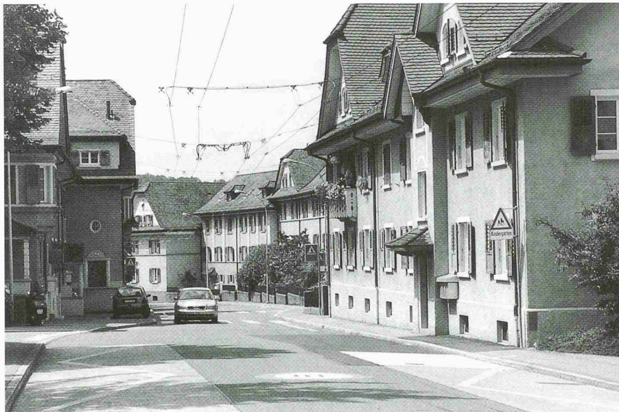
Das Dorfzentrum und der älteste Kern der Eisenbahnerbaugenossenschaft Luzern: Mit der Schaffung einer Tempo-30-Zone konnte die Lebensqualität in der Siedlung weiter verbessert werden