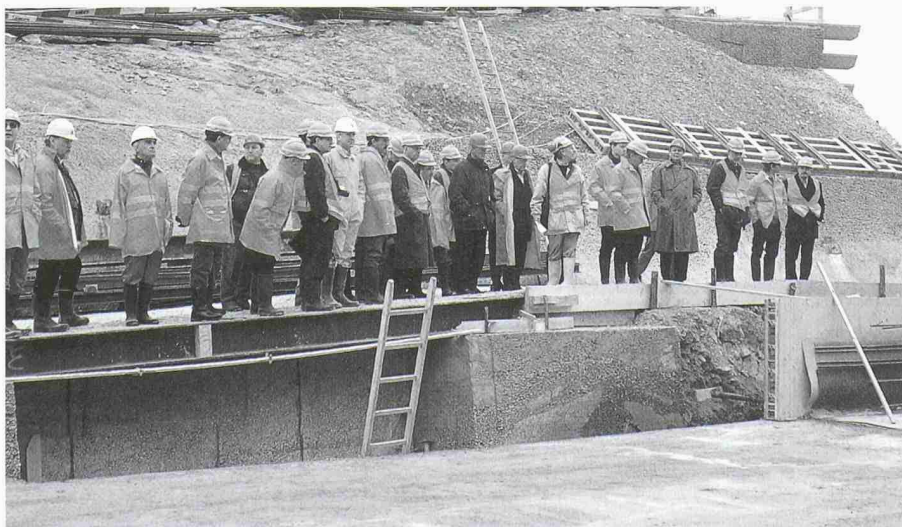
Baustelle der Bahn 2000 Zürich-Thalwil