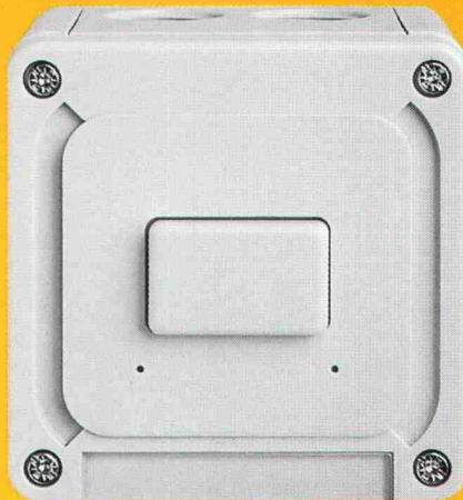
Schalter MAP 84 x 84 mm, Höhe 68 - 86 mm

Die Systemelemente lassen sich mittels Zwischenrippel beliebig kombinieren , können mit seitlichen Bohrungen versehen werden und tragen immer ein Bezeichnungsschild. Qualität bis ins Detail.