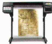
HP DesignJet 1055CM