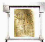
HP DesignJet 488CA