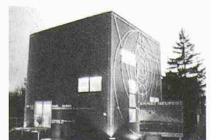
Neufert-Box in Gelmeroda/Weimar