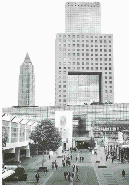
Messegelände Frankfurt: Strasse der Nationen

Auf einem derzeit brachliegenden Grundstück beim Messegelände soll in den nächsten sieben Jahren eines der modernsten multikulturellen Nutzungskonzepte Europas verwirklicht werden. Dieses «Europa-Viertel» wird auf einer Fläche von 90 Hektar Arbeits-, Wohn- und Freizeitwelten an einem Platz vereinen. Geplant sind ein 1,2 Kilometer langer Boulevard, ein Urban Entertainment Center mit über 13 000 Arbeitsplätzen und rund 4100 Wohnungen.