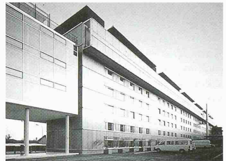
Bundesamt für Statistik, Neuenburg

dem Bundesamt in Neuenburg, wo schon vor Baubeginn ein Provisorium geplant werden sollte. Damit der Bau nach Gebrauch nicht einfach abgerissen würde, planten die Architekten ein Modulsystem, das sich auseinandernehmen und andernorts gleich oder anders wieder aufstellen lässt. Die bekannteste Anwendung findet der Gedanke im Projekt für ein Expohotel. Ob es gebaut wird, ist noch nicht ganz sicher. Ganz fleissig gebaut werden dagegen die modularen Schulpavillons in Zürich, die aus denselben Überlegungen entstanden sind. Einen mindestens ebenso grossen Erfolg wünscht man der neuesten Entwicklung, dem schmucken «smallhouse», einem aus zwei übereinander gestellten Holzmodulen bestehenden Kleinsthau. Das Grundmodell ist ab 113 000 Franken zu haben und soll in erster Linie bestehende Bauten ergänzen, wie ein Stöckli, wie ein Gästehaus, wie eine Arbeitsklausur.