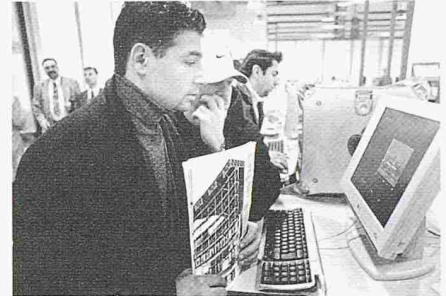
Per Mausklick abrufbar: Das neue SIA-Porträt mit über 100 Referenzobjekten von SIA-Mitgliedern und der Normensammlung

Als «Drehzscheibe für Planen und Bauen von Lebensraum mit Lebensqualität im 21. Jahrhundert» war der SIA-Stand im ersten Stock der Rundhofhalle ein gut besuchter Treffpunkt für private und öffentliche Bauherren, Mitglieder und potentielle Mitglieder – allen voran HTL- und Fachhochschulabsolventen, die sich für die assoziierte Mitgliedschaft interessierten –, aber auch Behördenvertreter und Partner aus der Bauwirtschaft trafen sich am SIA-