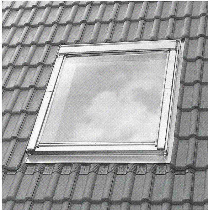
Verbesserte Integration ins Dach dank einem um 27 mm tieferen Einbau – die neue Dachfenster-Generation von Velux

Nemetschek Fides & Partner 8304 Wallisellen Tel. 01 839 76 76