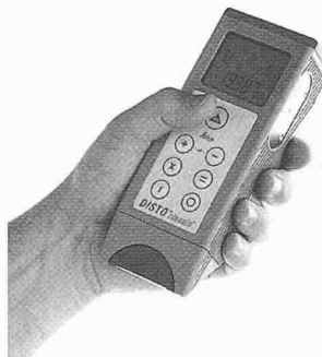
Hand-Lasermeter Disto classic 3 : kleiner, leichter und schneller als frühere Modelle

Der Disto classic 3 ist das Nachfolgemodell der weltweit führenden Hand-Lasermeter Disto basic. Mit dem Disto classic 3 lanciert Leica Geosystems die mittlerweile dritte Generation dieser Produktlinie. Das neue Gerät weist die bekannten Merkmale des Disto basic wie Zuverlässigkeit, einfache Handha-