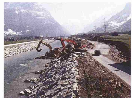
Ersatz des Uferschutzes

vier Kilometer verlaufende monotone Linienführung der Dämme zu durchbrechen. Einem Fluss den natürlichen Raum für das Mäandrieren wieder zuzugestehen, war im intensiv genutzten Raum jedoch nicht denkbar, umfasst die Mündungsebene doch wertvollstes Kulturland. Auch das Verlegen der parallel zur Reuss verlaufenden Autobahn hätte die finanziellen Möglichkeiten bei weitem gesprengt. Gleichwohl konnte eine Lösung gefunden werden.