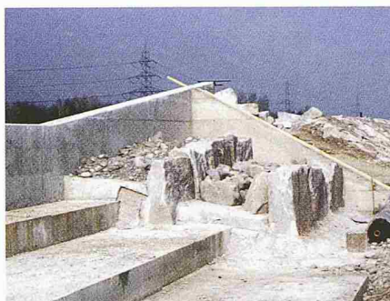
3 Entlastungsanlage Altdorf während des Baus (links)

Bei der Entlastungsanlage Altdorf er- eignet sich eine Überflutung alle 50 Jahre - entsprechend 620 m 3 /s Abfluss. Die An- lage setzt sich aus zwei rund 180 m langen Teilstücken zusammen. Auch diese in ihrer Höhe um rund 1 m reduzierten Dammab- schnitte sind überströmbar ausgebildet und liegen je leicht gegen die Reuss ange- winkelt plaziert. Aufgrund von hydraulischen Modellversuchen an der Versuchs- anstalt für Wasserbau der ETH Zürich wurde erkannt, dass auf diese Weise eine grössere Entlastungsmenge auf einer kür- zeren Strecke erreicht werden kann. Das Wasser, welches hier das Reussgerinne verlässt, ergiesst sich direkt auf die Auto-