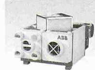
ABB Ventilatoren mit WRG 4 Anschlüsse 80 mm Ø; 400 m³/h, für Bad-/ WC- und Küchen-Ent- lüftung in STWE und EFH. Von ANSON!

ANSON DECOR Abzughauben für designbetonte Küchen und Kochin- seln. Auch inox. 230 V 400–1000 m³/h.–Ange- bot verlangen von: