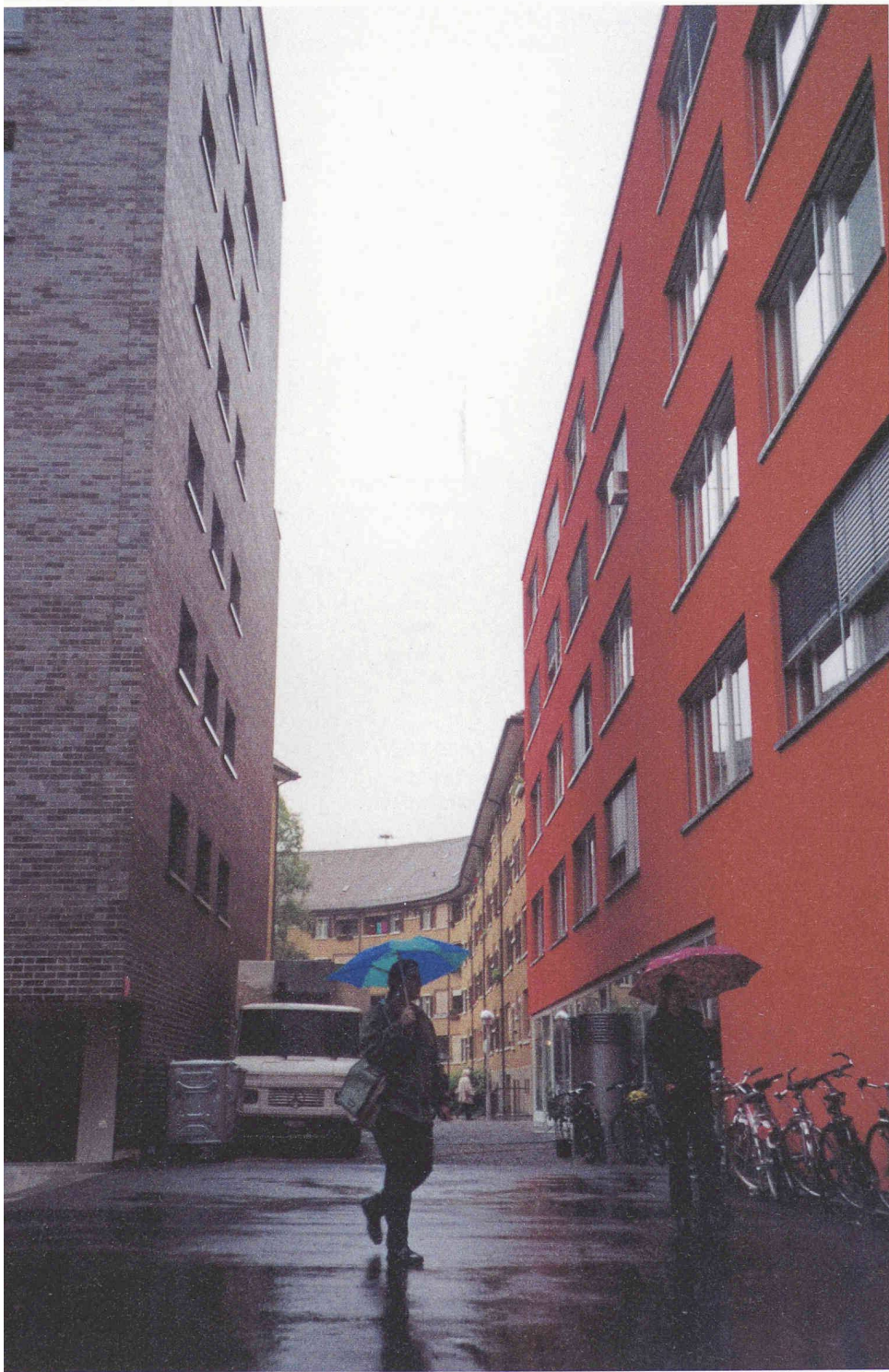
Urbanität und Dichte – die Zwischenräume im Kraftwerk 1 gemahnen teilweise an Altstadtgassen

ren wollen etwas bauen, das sicher weggeht, und mit einer 4 1/2-Zimmer-Wohnung zu einem moderaten Preis kann man in Zürich nie falsch liegen. Der Immobilienfonds einer Pensionskasse wird kaum versuchen, Ateliers oder WG-Wohnungen zu vermieten, obwohl ich überzeugt bin, dass der Markt dafür mindestens so gut wäre. Aber solange man in Zürich sowieso jede Wohnung vermieten kann, muss man sich auch nicht furchtbar viel Mühe geben, etwas Neues zu erfinden.