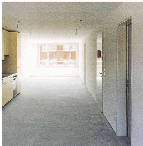
Neun Stöcke hoch und 20 m tief – das zentrale Haus A sprengt die heute im Wohnungsbau üblichen Masse

Und anders als sonst ist schliesslich, dass die versammelte Presse bei uns anklopft und sich für einmal für die Leistungen eines GU interessiert. Anfänglich für die ungewöhnliche Zusammenarbeit von früheren «Feinden», von ehemaligen Wohnungsnot-Demonstranten und Hausbesetzern mit der ehemaligen Immobilientochter des Bührlle-Konzerns. Seit nun das Kraftwerk steht, interessiert vor allem die Architektur, das Zusammenleben in diesen ungewöhnlichen 13-Zimmer-Wohnungen. Die Resonanz ist also gross und positiv. Und wir sind auch stolz auf unseren Beitrag zu diesem Bau.