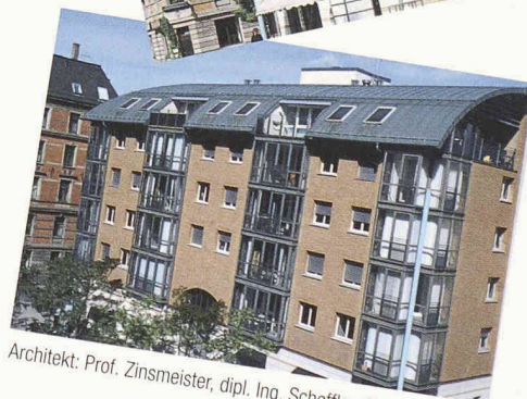
Architekt: Prof. Zinsmeister, dipl. Ing. Scheffler, Stuttgart

Das Prädikat wertvoll für Objekt und Material. Die kelesto® -Linie der Keller AG Ziegeleien für innovative Architektur in Sichtstein und Klinker.