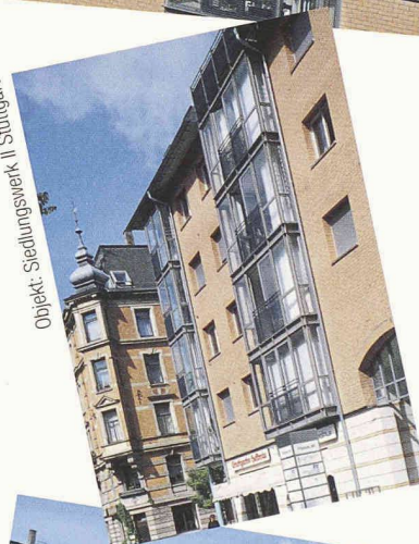
Objekt: Siedlungswerk II Stuttgart