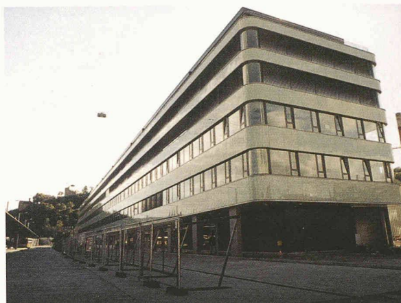
Das Wohn- und Geschäftsgelände «Langhaus» (Architekt Jan Hlavica, Metron AG) und der neue Busterminal am Bahnhof Baden (oben)

Die Stadt Baden wurde vor rund zehn Jahren durch den Niedergang der BBC, deren Fusion mit der ABB und den Verlust Tausender von Arbeitsplätzen hart getroffen. Erstaunlich schnell hat sich die grösste Stadt im Kanton Aargau von diesem Schlag erholt – die Not hat die Innovation gefördert. Die Eröffnung des erweiterten und neu gestalteten Bahnhofs ist eine weitere Etappe in einer erfolgreichen Planungsgeschichte.