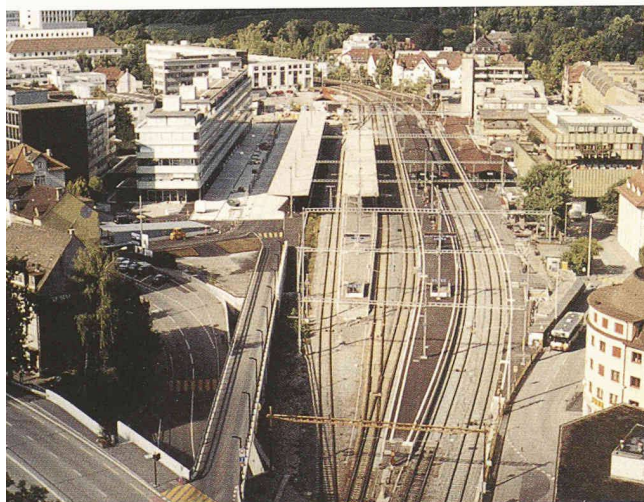
Übersicht über die erweiterten Gleisanlagen mit Busterminal, neuer Zufahrtsrampe und dem «Langhaus» (links)

(rw/pd) Nach dem ersten grossen Schock, den der Niedergang der BBC für die traditionelle Maschinenindustriestadt bedeutete, hat sich Baden bald einmal auf seine anderen Stärken als Dienstleistungs- und Bildungszentrum der Region besonnen. Auf dem von der redimensionierten Industrie freigegebenen Gelände «Baden Nord» konnten dank enger Kooperation der Stadt Baden mit ABB-Immobilien und einer unternehmerischen Planung neue Dienstleistungen angesiedelt und Wohnungen geplant werden. Die zwischen 1988 und 1993 verloren gegangenen Arbeitsplätze konnten in den letzten fünf Jahren kom-