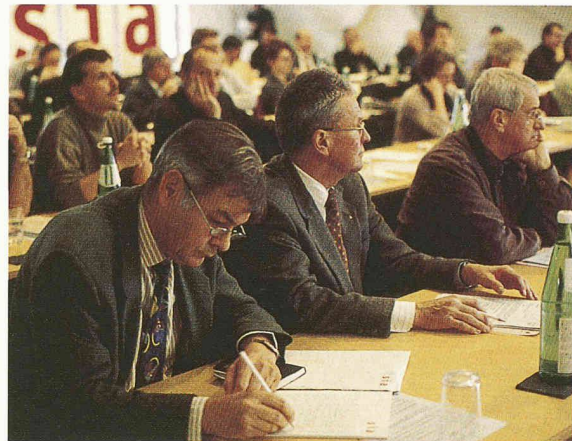
Kommissionen und Projektgruppen leisten mit ihrer Milizarbeit einen entscheidenden Beitrag zum Erfolg des SIA

Gemäss dem Bundesgesetz über technische Handelshemmnisse sind SIA-Normen nicht rechtsverbindliche, durch eine private normenschaffende Organisation aufgestellte Regeln. Sie geben den Stand der Technik bzw. der Baukunde wieder und gelten als anerkannte Regeln der Technik bzw. der Baukunde. Der Erlass von Vorschriften bezüglich Bauwerken ist eine klassische Domäne der Kantone. SIA-Normen vermögen einen Beitrag zur interkantonalen Harmonisierung der technischen Vorschriften zu leisten, sofern sie in die kantonalen Gesetzgebungen aufgenommen werden – in expliziter Form oder auch in der Form eines Verweises auf die anerkannten Regeln der Baukunde. Der SIA hat den Auftrag, Baunormen zu erarbeiten (von Einzelfäl-